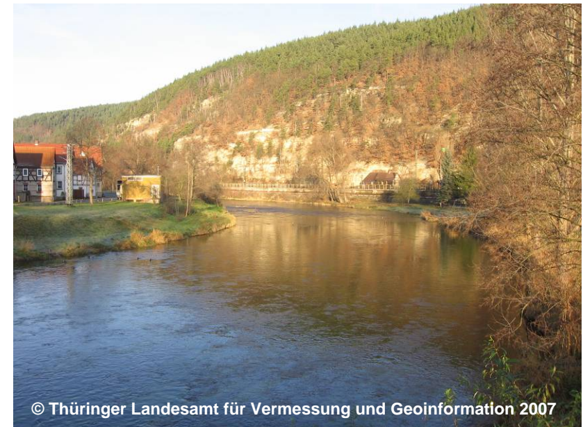
Beispiel für einen Kanal